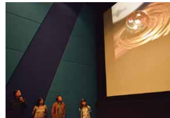
「中之条ビエンナーレと木津川アート参加作家集合」