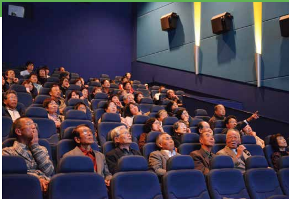
「昔の写真を見ながらしゃべろう」 大里・曽根山地区のみなさん