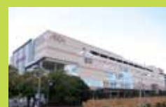
2 イオンモール高の原